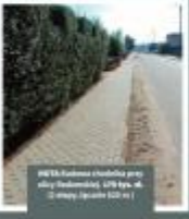
BIAŁYSTOK Budowa obiektu rekreacyjnego w miejscowości Białystok, ul. Słoneczna 1000 m.