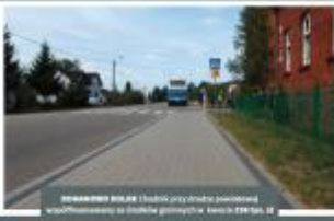
BIAŁYSTOK Budowa obiektu rekreacyjnego w miejscowości Białystok, ul. Słoneczna 1000 m.