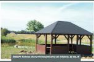
BIAŁYSTOK Budowa obiektu rekreacyjnego w miejscowości Białystok, ul. Słoneczna 1000 m.