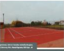
BIAŁYSTOK Budowa obiektu rekreacyjnego w miejscowości Białystok, ul. Słoneczna 1000 m.