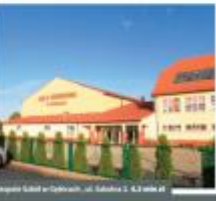
BIAŁYSTOK Budowa obiektu rekreacyjnego w miejscowości Białystok, ul. Słoneczna 1000 m.