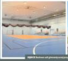
BIAŁYSTOK Budowa obiektu rekreacyjnego w miejscowości Białystok, ul. Słoneczna 1000 m.