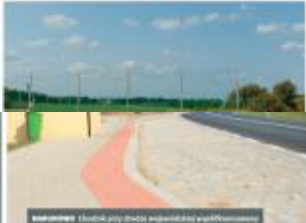
BIAŁYSTOK Budowa obiektu rekreacyjnego w miejscowości Białystok, ul. Słoneczna 1000 m.