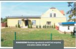
BIAŁYSTOK Budowa obiektu rekreacyjnego w miejscowości Białystok, ul. Słoneczna 1000 m.