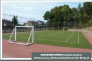
BIAŁYSTOK Budowa obiektu rekreacyjnego w miejscowości Białystok, ul. Słoneczna 1000 m.