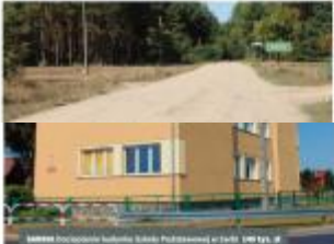
BIAŁYSTOK Budowa obiektu rekreacyjnego w miejscowości Białystok, ul. Słoneczna 1000 m.